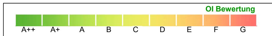
Abbildung 1: Horizontaler Skalierungsbalken mit Einteilung in neun Klassen

Die Darstellung der ökologischen Einstufung erfolgt mittels einer verlaufenden Farbskala. Diese verläuft von Grün (links) über Gelb nach Rot (rechts). Der Skalierungsbalken ist in neun gleichgroße Abschnitte, anhand der Systematik des Energieausweises in den Qualitätsklassen A++ bis G, unterteilt. Fehler! Verweisquelle konnte nicht gefunden werden. verdeutlicht den Skalierungsbalken für die Bauteilbewertung.