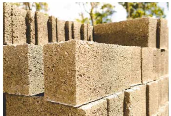
Deklarierte Bauprodukte beinhalten ökologische Kriterien, bauphysikalische und bauökologische Kennwerte und produktgruppenabhängige Eigenschaften.

In baubook befinden sich geprüfte Produkte, Richt- und Kennwerte, Herstellerinfos, Kriterien und Plattformen.