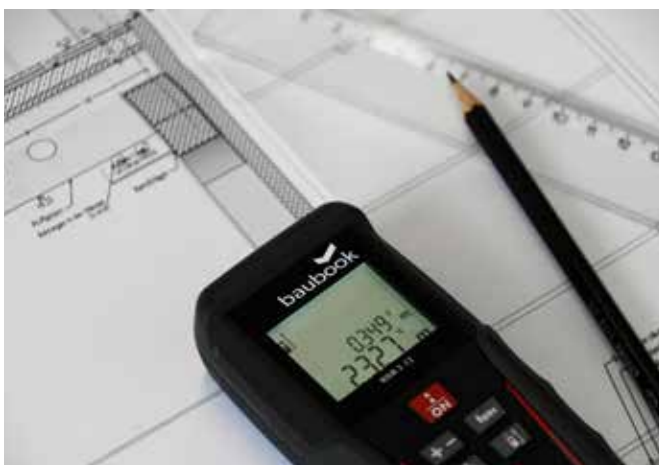
Den Kern der baubook bildet eine umfassende Produktdatenbank sowie nützliche Tools und Werkzeuge für die Berechnung diverse Gebäudekennzahlen.

baubook ist eine Datenbank für Bauprodukte. Sie vereinfacht ökologisches und gesundes Bauen und erleichtert die Nachweisführung im Rahmen von ökologischen Ausschreibungen, Gebäudezertifizierungen und Fördersystemen. baubook liefert validierte und strukturierte Baustoffdaten für die Berechnung von Energie- und Ökologiekennzahlen.