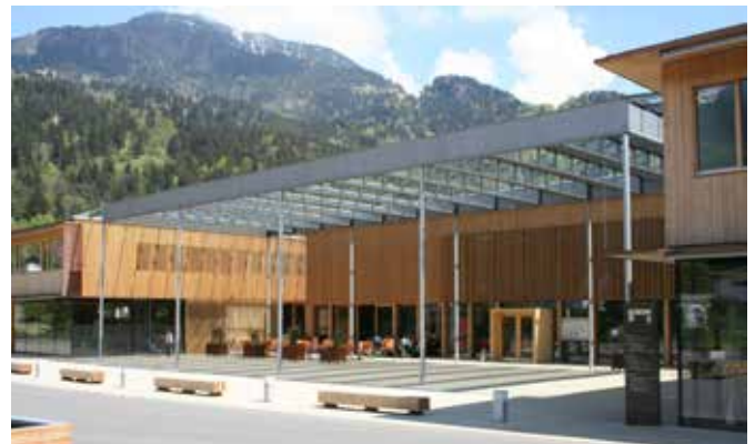
Gemeindezentrum Ludesch

Vorarlbergs Gemeinden haben nach diesen Standards in den vergangenen Jahren über 100 Neubau- und Sanierungsprojekte umgesetzt.