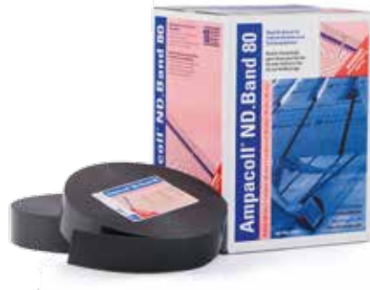
Ampacoll® ND.Band 80: Nageldichtband, 80 mm breit