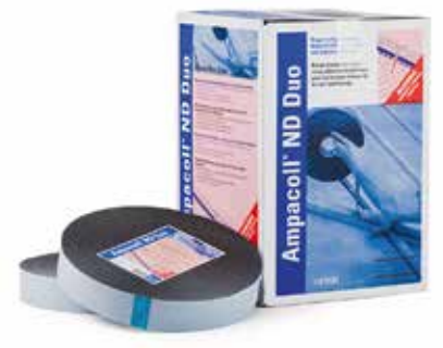
Ampacoll® ND Duo: Beidseitig klebendes Nageldichtband