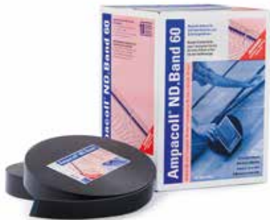
Ampacoll® ND.Band 60: Nageldichtband, 60 mm breit