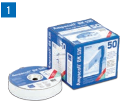
Ampacoll® BK 535: Butylkautschukband