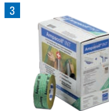
Ampacoll® INT: Acryklebeband