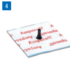
Ampacoll® Elektro u. Install: Manschetten