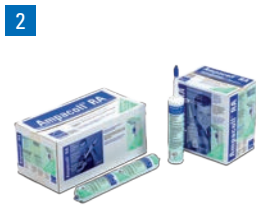
Ampacoll® RA: Flüssigklebstoff