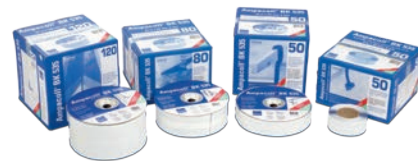
Ampacoll® BK 535 Für Durchdringungen