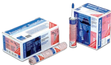
Ampacoll® Superfix Für Randanschlüsse