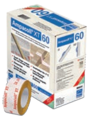
Ampacoll® XT Für Überlappungen