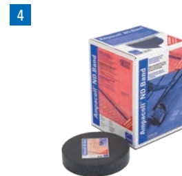
Ampacoll® ND.Band: Nageldichtband