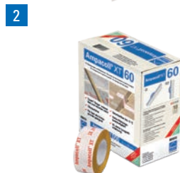
Ampacoll® XT 60: Acrylklebeband