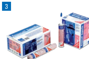
Ampacoll® Superfix: Flüssigklebstoff