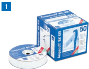
Ampacoll® BK 535: Butylkautschukband