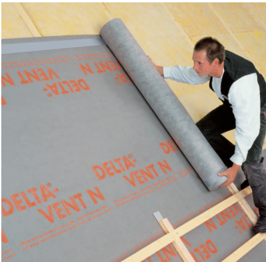
DELTA®-VENT N PLUS bietet als 3-lagige Bahn besondere Vorteile bei der Verarbeitung.