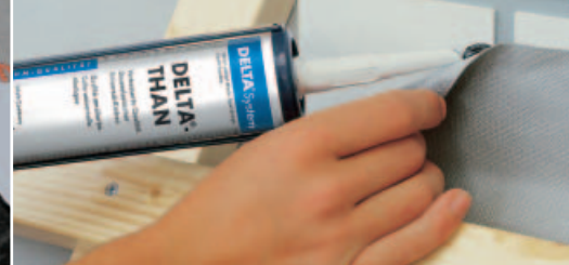
Winddicht durch integrierte Klebezonen.