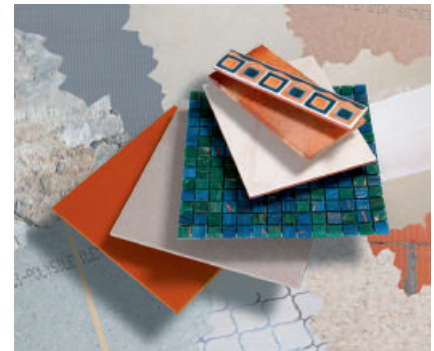
Variables Leistungsspektrum – für alle Untergründe und alle keramischen Beläge.