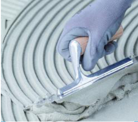
Aufziehen von Adesilex P9 weiß

JEDE ABÄNDERUNG DES TEXTES ODER DER ANFORDERUNGEN, DIE IN DEM TECHNISCHEN MERKBLATT ENTHALTEN SIND ODER AUS DIESEM ABGELEITET WERDEN, FÜHREN ZUM AUSSCHLUSS DER VERANTWORTUNG VON MAPEI.