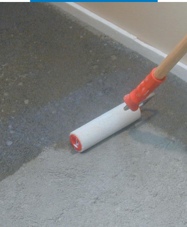
Auftragen von Primer G mit der Rolle