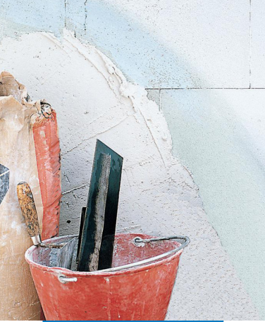
Als Grundierung für gipshaltige Untergründe