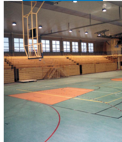
Anwendungsbeispiel für Primer G vor der Verlegung von PVC- und Linoleumbelägen in der Sporthalle des Orunia - Gymnasiums in Danzig - Polen

Alle relevanten Referenzen zum Produkt sind auf Anfrage oder im Internet unter www.mapei.com erhältlich