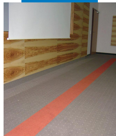
Anwendungsbeispiel für Primer G vor der Spachtelung mit Ultraplano Eco und der Verlegung textiler Beläge mit Rollcoll im Hotel Villa Castellani - Österreich