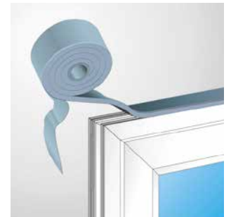
Komplette Abdichtung in einem Arbeitsschritt