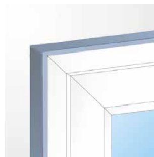
Ecke - stumpf gestoßen