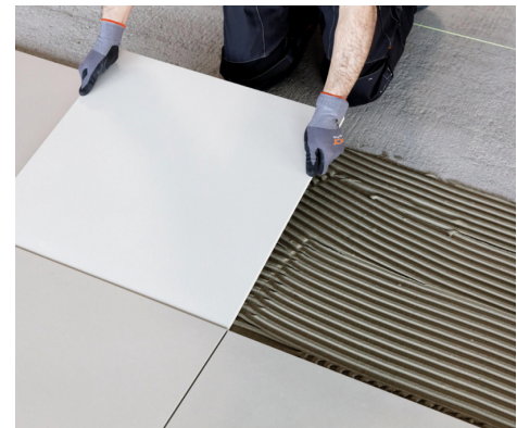
Verlegen von Feinsteinzeugplatten.