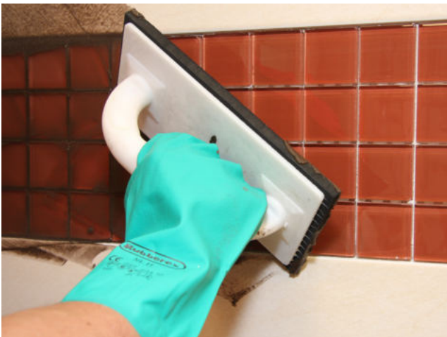
Einfugen von Sopro DF 10 in Glasmosaik.