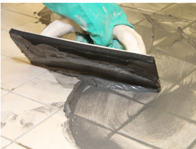
Einfugen von Sopro DF 10 in Feinsteinzeugfliesen.