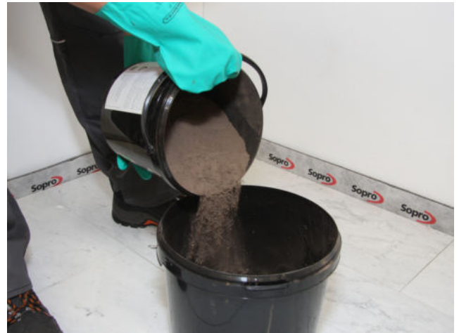
Sopro DF 10 zudosieren und maschinell anrühren.