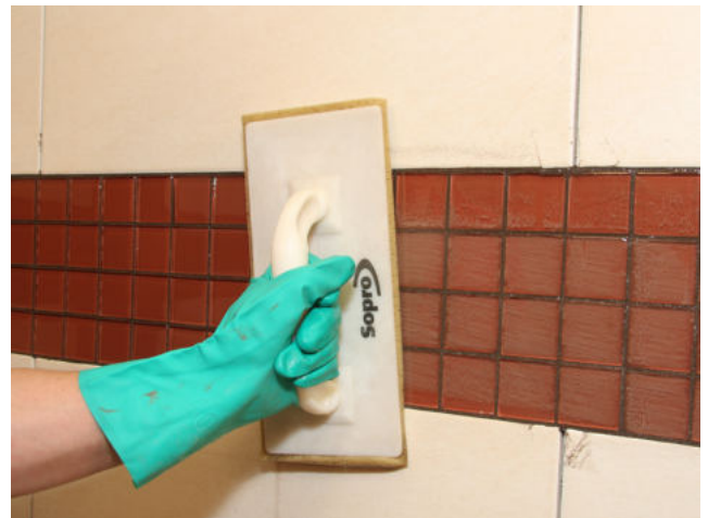
Abwaschen des Glasmosaiks nach ausreichender Standzeit des Fugemörtels.