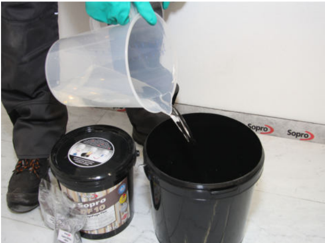
In einen sauberen Eimer sauberes Wasser gemäß Tabelle vorgeben.