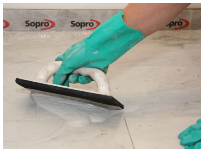
Einfugen von Sopro DF 10 in verarbeitungsempfindlichen Naturstein.