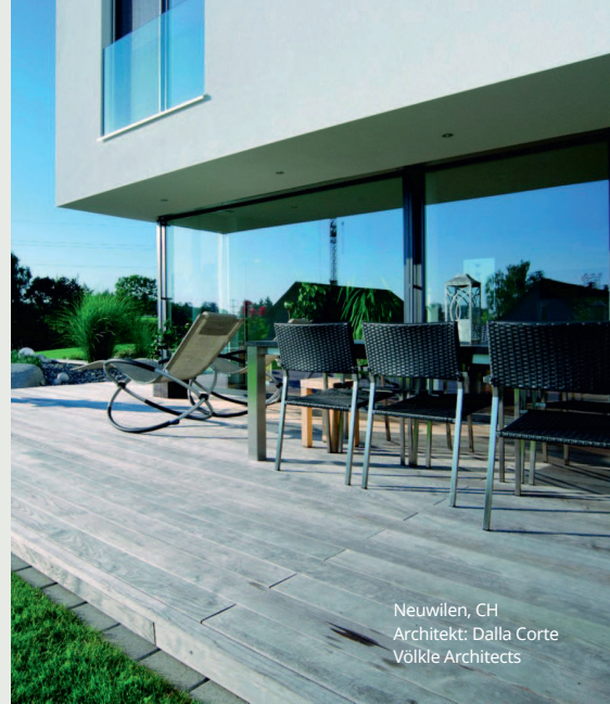
Neuwilen, CH Architekt: Dalla Corte Völkle Architects