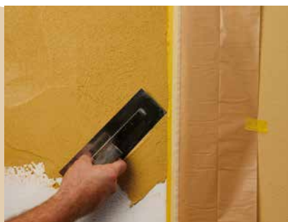
Auftrag der zweiten Farbe