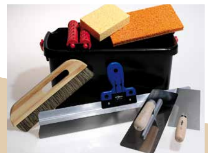
CLAYTEC bietet Japankellen, Schablonen und anderes ausgewähltes Profiwerkzeug an.

Für große Flächen muss also ein entsprechend großer Kübel Material vorbereitet werden!