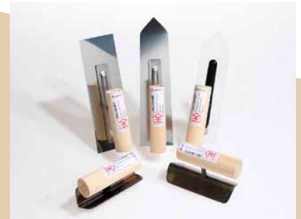
Japan-Glätter und -Feinputzkelle, feine Kunststoffkelle, Kehlen- und Kantenkelle