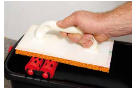
Ausrollen des Filzbretts

Für ein homogenes Ergebnis muss die Mörtelfläche zum Zeitpunkt der Bearbeitung gleichmäßig angetrocknet sein!