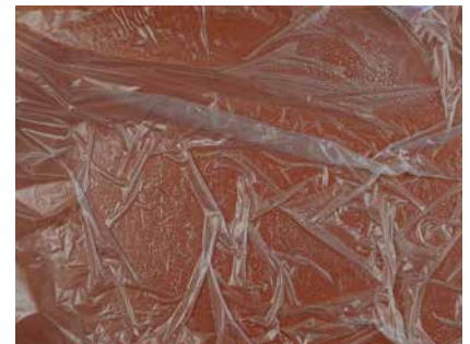
Marmoreffekt: Folie auf der Spachtelfläche

Lehm-Farbspachtel wird nicht wie Kalkspachtel verarbeitet! Lehm-Farbspachtel wird weder „verpresst“ noch „gebügelt“ sondern ohne Druck geglättet, bis die erwünschte Oberflächenoptik erreicht ist.