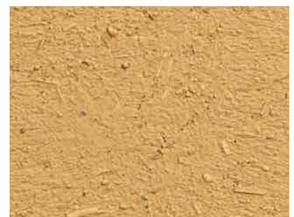
Struktur einer gut vorbereiteten Fläche aus Lehm-Unterputz