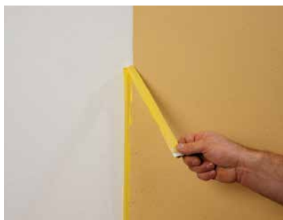
Abziehen nach dem Abwischen