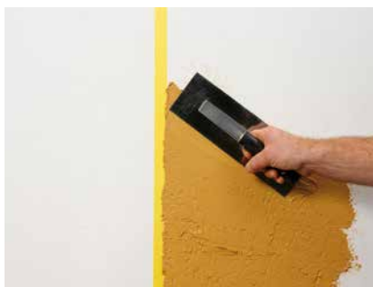
Auftrag der ersten Farbe an das Klebeband

Anders als andere Farbtöne kann YOSIMA WE 0 nach dem Trocknen nicht nur mit einem weichen Schwamm, sondern auch mit einem orangenen Schwamm-brett freigewischt werden. Bei diesem Arbeitsgang kann die Fläche sogar noch nachgerieben werden.