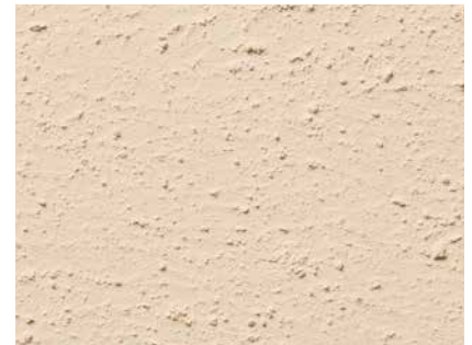
Struktur einer mit Grundierung „DIE GELBE“ vorbereiteten Gipskartonplattenfläche

Vorsicht bei alten Gipskartonplatten! Die Kartonage kann vergilbende Stoffe enthalten, die durchschlagen.