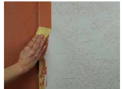
Abziehen scharfer Winkel

Mechanischer Kantenschutz ist am besten mit Eckprofilen zu lösen. Ungeschützte Kanten sind sehr empfindlich, leicht können störende Abplatzungen auftreten. Auch für weniger beanspruchte Kanten sind die Profile zu empfehlen, da eine Kantenausführung nur mit dem Spachtel schwierig ist. Die Profile müssen schon im Putzuntergrund vorgesehen werden.