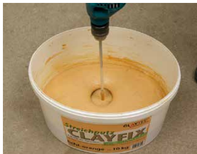
Nach 30 Minuten Quellzeit gut durchrühren