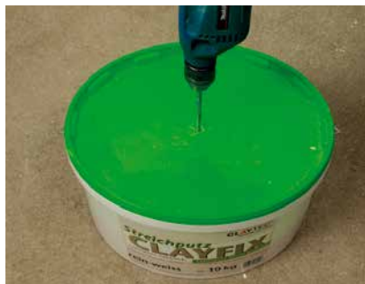
Bei geschlossenem Deckel einmischen